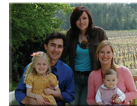
L'accompagnement non-médical à la naissance