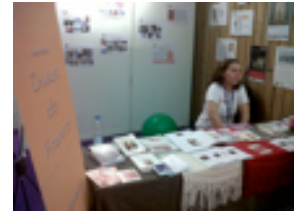
Paris 11, 12 et 13 mars

Mais aussi : Lyon les 18 et 20 février, Bordeaux les 5 et 6 mars, Paris les 30 septembre, 1 et 2 octobre, Lille les 22 et 23 octobre, Strasbourg les 5 et 6 octobre, Rennes les 19 et 20 octobre