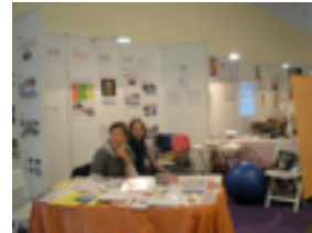
Marseille 26 et 27 mars